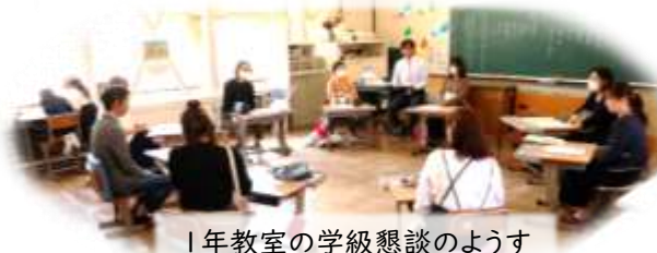
1年教室の学級懇談のようす

参観授業前にはPTA総会、授業後は学級懇談会にもご参加ください、ありがとうございました。PTA総会では、審議事項の他、複式学級など今後の学級編成、給食会計の公会計化、緊急時の児童用食料備蓄など、複雑な話を短時間でいたしました。ご質問やより詳しい説明の必要があればご連絡ください。