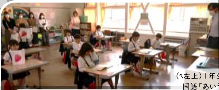
(ハ左上) 1年生 国語「あいうえおのうた」

楽しい連休をお過ごしだったことと思います。令和5年度がスタートして1か月。新しい学年になって様々な変化もありましたが、それらにも慣れてきて、本格的に学習も始まりました。先週の参観日にはたくさんのご家族に学習の様子を見ていただきました。ありがとうございました。これまでとの違いやお子さまの新たな発見など、見ていただいた感想を連絡帳などでお寄せいただいた方もいらっしゃいました。お気づきのことや疑問点などがございましたら、いつでもご相談ください。