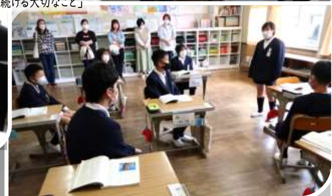
(\右下) 6年生 学活「一年間続ける大切なこと」

参観授業前にはPTA総会、授業後は学級懇談会にもご参加ください、ありがとうございました。PTA総会では、審議事項の他、複式学級など今後の学級編成、給食会計の公会計化、緊急時の児童用食料備蓄など、複雑な話を短時間でいたしました。ご質問やより詳しい説明の必要があればご連絡ください。