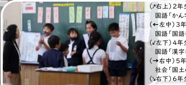
(←左中) 3年生 国語「国語じてんの使い方」