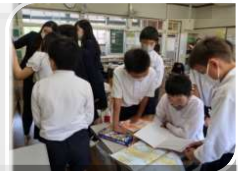
(√左下) 4年生 国語「漢字じてんの使い方」