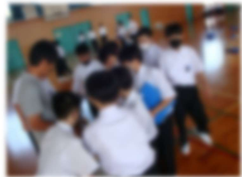
9月29日(金)1年生事前学習会 (岡山空襲展示室から展示物を借りて実施)