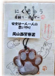
贈呈された反射材