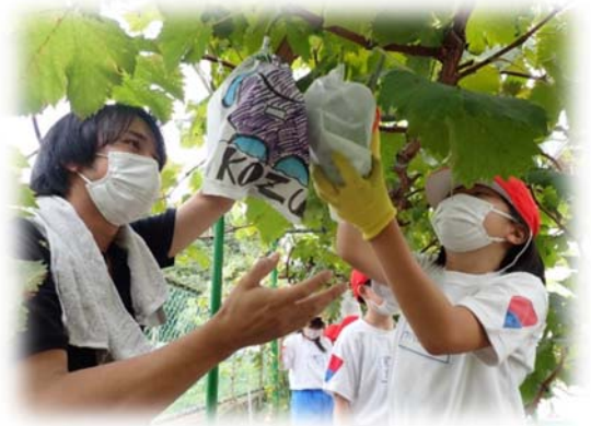
ぶどうの収穫体験（9月9日）

今後の3年生の学習では、「みんなで話し合っ、お世話になった地域の方々に向けて学んだことを伝えていく」ことをめざしているのだそうです。「分かったことをどのようにまとめ、どう伝えていくのか？」という学習のゴールにはまだ到達していませんが、「古都のぶどう栽培から学んだ気づき」「感動した気持ち」などを分かりやすく伝えるように努力するということでした。学習したことを地域の方々に伝えることで、地域の方々に喜んでいただくことができれば、子どもたちの意欲や充実感はさらに高まっていくように思いました。