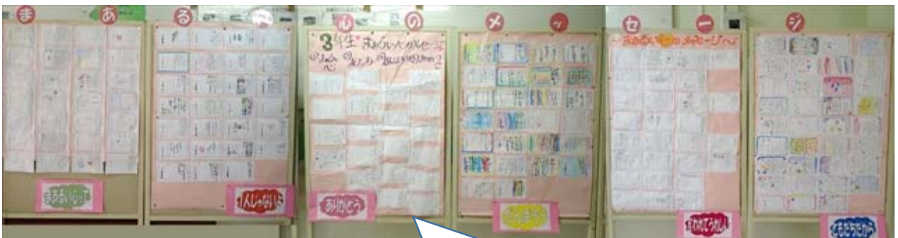
掲示された180人の「まあるい心のメッセージ」