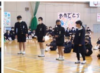
↑会の立役者は5年生