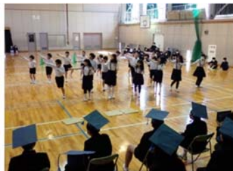
↑キレイのあるダンスでお祝い