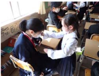
↑メダルをかけてもらいました

6年生は今まで学校生活の多くの場面で、下学年の子どもたちによい手本を見せてきました。登校班の世話に始まり、委員会活動を通じた学校生活をよりよくするための活動、あるいは1年生の教室での補助など、教室以外での活動を挙げるだけでもきりがありません。そして、普段から友達や周囲の人を大切にしようとする思いやりの心があるところも見せてくれました。下学年の人から「私たちもあんな6年生になりたいな。」と思われる存在であったように思います。6年生の優しい姿は5年生以下の子どもたちにもきっと受け継がれていくことでしょう。