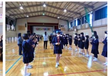
↑4、5年生に見送られて退場

そんな6年生たちの卒業式がいよいよ明日となりました。ご卒業、おめでとうございます。