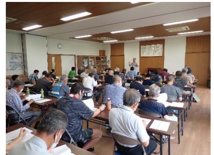
↑ 古都学区安全・安心まちづくりの会総会

また、7月8日（土）には、「古都学区安全・安心まちづくりの会」総会が開かれ、連合町内会長様、交通安全対策協議会長様、民生・児童委員協議会長様、交通安全母の会会長様等多くの方々が集合されました。「古都学区安全・安心まちづくりの会」は、「交通安全活動」「自主防災活動」「環境整備活動」等について地域の皆様が協力して取り組み、住みよいまちづくりをめざすことを目的としています。その活動の柱には子どもたちの見守り活動が位置づけられていて、「古都学区安全・安心のまちづくりの会（見守り隊）」の方40名が学区内の10箇所、また「古都学区安全パトロール隊」の方25名が水曜日の巡回パトロールや自主パトロールなどに取り組まれています。年間を通じて、子どもたちが安心して登下校ができるように、協力していただいているのです。