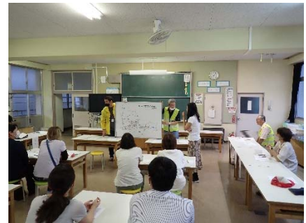
↑ 古都小登下校見守り関係者打ち合わせ会

先月6月23日（金）、古都小登下校見守り関係者打ち合わせ会を実施しました。見守り隊の方々、PTA地区代表の方々、校長、教頭が出席し、子どもたちの登下校中の様子、通学時の危険箇所等について、意見・情報交換をしました。通学路の交通の状況や危険箇所等について共有し、行政等への環境整備のお願いなどを含め、地域と学校がどのように対応していくべきかを話し合いました。