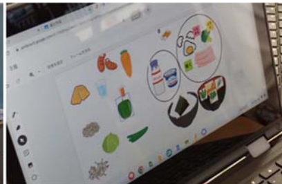
↑ 色どりや栄養を考え、献立を改善。