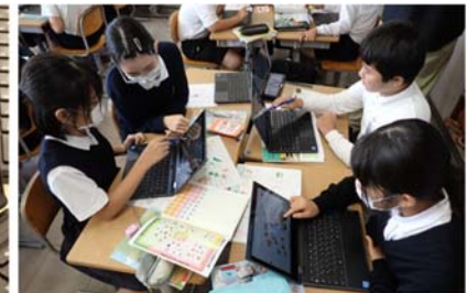
↑ 画面を見ながらグループで話し合う。

授業中のコミュニケーションの基本は先生や子どもたち同士の会話です。しかし、タブレット端末を介したやりとりでは、一見静かであっても画面の中の情報から友達同士の対話が進む場面を目にします。画面上に示された友達の表現から新しい気づきを得たり、自分の思いを修正したりし、情報のやりとりを通じて自分の考えを深めます。またグループとしての結論を整理し集約するような場面では、従来の学習と同じように手元の画面を共有して活発に話し合う姿も見られます。さまざまな情報や手段を使って、子どもたちが意見を交換し学習を深める姿を目の当たりにすることができました。