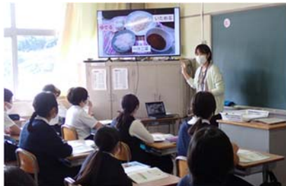
↑ 改善前の献立...「何だか味気ないなあ。」

最初に児童一人ひとりが自分の考えた献立をタブレット端末の上で表現しました。次に、4～5人の小グループで個々の考えを紹介し各自の改善ポイントを伝え合った後で、グループのアイデアをまとめてから、代表の人が学級全体に献立の内容や工夫について発表しました。子どもたちは、献立を供する相手の年齢や状況を考えて、献立に加えた工夫について語り意見を交換し合いました。