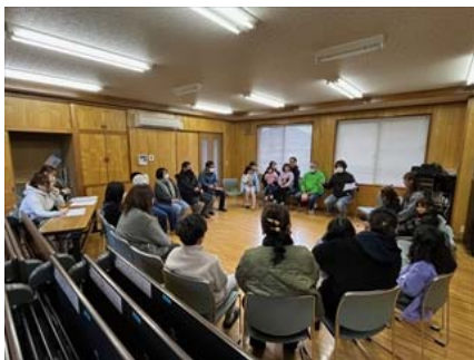
地区懇談会で地域の状況を共有しました。

また、26日（日）には、旭東中学区青少年育成協議会が実施する「ふれあいクリーン作戦」と「地域教育懇談会」を実施しました。ふれあいクリーン作戦には、古都小学校の各地域で、児童、保護者、地域の方々、教職員が協力して清掃活動に取り組みました。また地区懇談会では、地域の皆様と子どもたちの状況等について話し合う機会とすることができました。コロナ禍で途絶えていた懇談会を再開し、子どもたちのよいところや課題を多くの皆様方と共有することができ大変ありがたかったです。