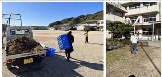
古都小PTAぴかぴか作戦。運動場が美しくなりました。

11月21日（火）、古都小ぴかぴか作戦には、保護者と地域の方7名にご参加いただき、学校内の草刈り等の美化作業に取り組んでいただきました。運動場の東側の草むら、体育倉庫、プールの側のやぶなど、長い間手入れができなかった場所が瞬く間にきれいになり、運動場に出た子どもたちも驚くほどの仕上がりでした。今後も継続できればと願っております