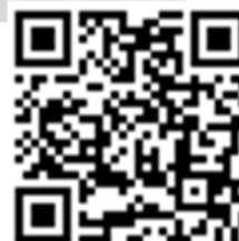
古都小ホームページ

左のQRコードから古都小学校のホームページを閲覧できます。「こづ小」で検索でもOK!