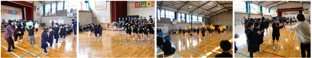
↑ 1年生と早口言葉対決！

普段から周囲の人を大切に、「気持ちのよいあいさつ」「優しさ」「感謝の心」などをすなおに表現してきた6年生の姿は、下学年の人たちのすばらしい手本でした。これからの古都っ子たちにもぜひ引き継がれていってほしいと願っています。