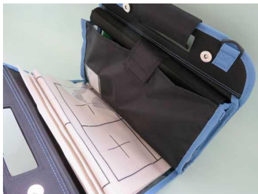
左:書道バック(軽量タイプのバックです) 右:書道バックを開いた様子