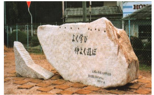
125周年記念碑 H9 建立】

児童は山間に広がる農村地域と昭和61年に完成した住宅団地から通ってきている。保護者・地域の学校教育への関心は高く、シルバーPTAの活動等大変協力的である。