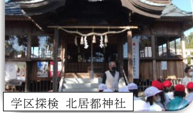
学区探検 北居都神社