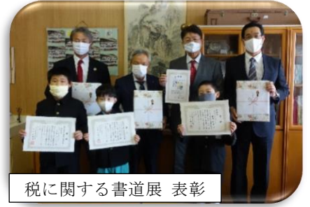
税に関する書道展 表彰

令和2年も地域の皆様を始め、保護者の皆様のご理解ご協力をいただき、平島小の子どもたちは、生活面・学習面において力を伸ばし成長することができました。ありがとうございました。