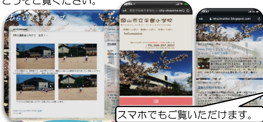
スマホでもご覧いただけます。