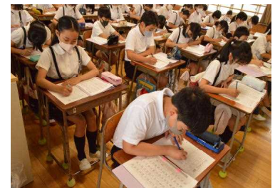
落ち着いた1日のスタート

子どもたちの様子を見てみると、落ち着いて、かつ真剣な顔つきで、時には笑顔で活動に取り組んでいたことに感心しています。1学期にたくさんの力を付け成長したことを、自分でも実感したことでしょう。これもひとえに、日