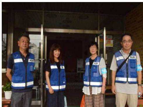
見守り中の協助手員さん

月に1回、京山学区の児童生徒を見守るために、協助手員の皆様が来校し、校内を巡回してくださいます。特に大きな問題の無い地域ですが、京山学区の学校を回ることによって、内外の問題が起らないように抑止力に繋がっているようです。