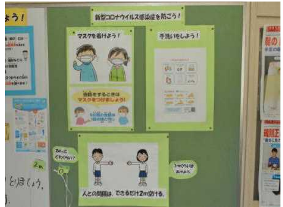
保健室廊下掲示物 「コロナを防ごう」

4月に新型コロナウイルス感染症対策で臨時休校になり、5月21日より学校が再開しました。ご家庭では、朝晩の検温と健康管理にご留意いただき、児童は、元気に学校生活を送ることができました。ありがとうございました。心より感謝いたします。