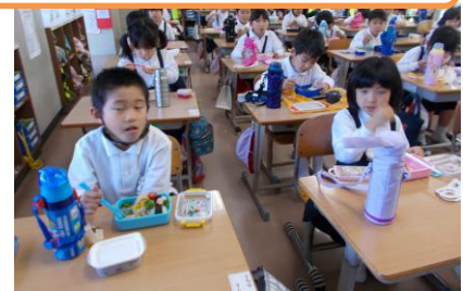
各教室でおいしいお弁当♡