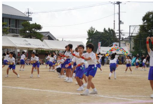
3・4年生 表現 「WONDERFUL 興除～海から生まれて200年～」