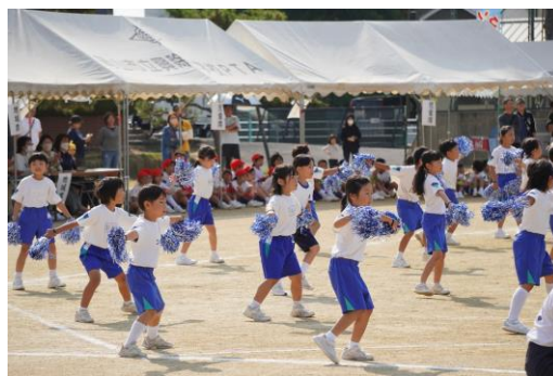
1・2年生 表現 「おいでよ こうじょ 150さいパーティー」