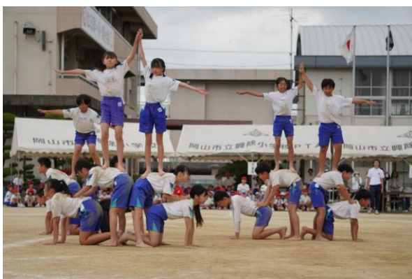
5・6年生 表現 「創～150年のその先へ～」