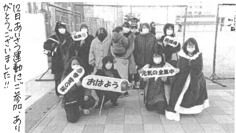
12月あいさつ運動にご参加、ありがとうございました!!