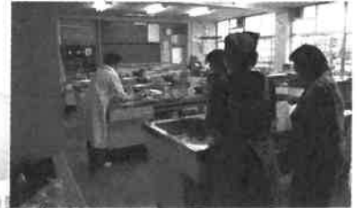
400人分のみそ汁を作ったスタッフは給食調理員さんと栄養士の先生たち。これも全員ボランティアでした。子どものためのお手料理レシピが参加者に配布されました。