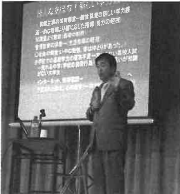
豊富な実践から得られたデータに裏付けられた教育論。時のたつのを忘れて聞き入ってしまいました。

このことから、子どもたちにとって「睡眠と食事」がいかに大切かが理解できると思います。さらに陰山流の食事についていえば「朝食を食べている子ほど学力が高い。一食に使われる食材の量が多いほど学力が高い。特に朝食が重要で、ご飯とみそ汁がよい。」さっそく保護者の力が試されていますよ。(文責 森谷)