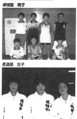
卓球部 男子 柔道部 女子