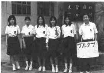
(岡輝中学校文化活動部)

「800kg集め、車いすをマンマの子どもに送ろう」というスローガンのもと、空き缶のタブ(ブルタブ)を集めています。1年間の取組で現在約20kgが回収できました。先の長い話でどのように歴史をつなごうかとも悩んでいます。挑戦しています。毎週水曜日の朝、校門で回収していますので、地域の皆様のご協力をお願いします。