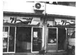
クリーニング店「国安」

いろいろと心温まるお話が聞けました。お店の前は小・中学校の通学路で道路に面した部分がガラス張りなのでいつも登校中のお子さんを見てくださっているようで、具合が悪くなったお子さんや溝に落ちたお子さんを保護して学校へ連絡したことなどもあるそうです。トイレを借りる子や、お水くださいというお子さんもいらしたとか…。最近の世相のせいか、おはようっとなを掛けても、知らない振りをして通り過ぎていくお子さんが多くなってきて、寂しいわね〜との事でした。とても感じよいご夫婦で、嬉しくなりました。