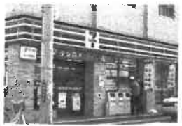
セブンイレブン 奥田2丁目店