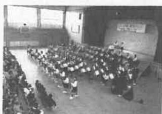
岡山南高校吹奏楽部