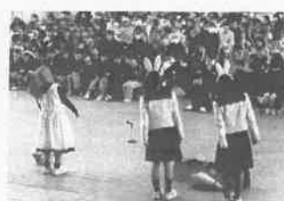
岡山南高校 生活創造科 2年生 保育発表