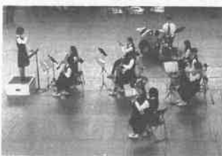
岡輝中学校吹奏楽部