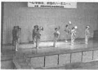
岡南区婦人会 民謡