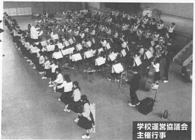
学校運営協議会 主催行事

岡輝中学校区の学校園は、全国に先がけ、平成14年度～16年度に文部科学省から「コミュニティ・スクールに関する法案づくりのための実践研究」の指定を受けました。その後、「コミュニティ・スクールを全国に広めるための推進事業の指定(平成17・18・20年度)」、「岡山市地域協働学校1号(現在8年目)」の指定を受け、コミュニティ・スクールの推進に向けて中心的役割を果たしてきました。