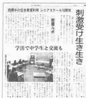
山陽新聞2013年2月9日号掲載