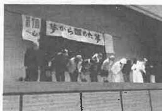
シニアスクール岡輝教室「夢から醒めた夢」