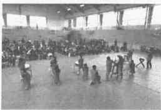
清輝小学校3年生 和太鼓