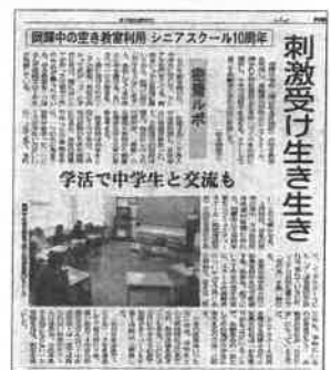
山陽新聞2013年2月9日号掲載