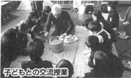
子どもとの交流授業