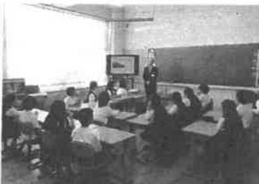
外部講師より交通マナーについて学ぶ