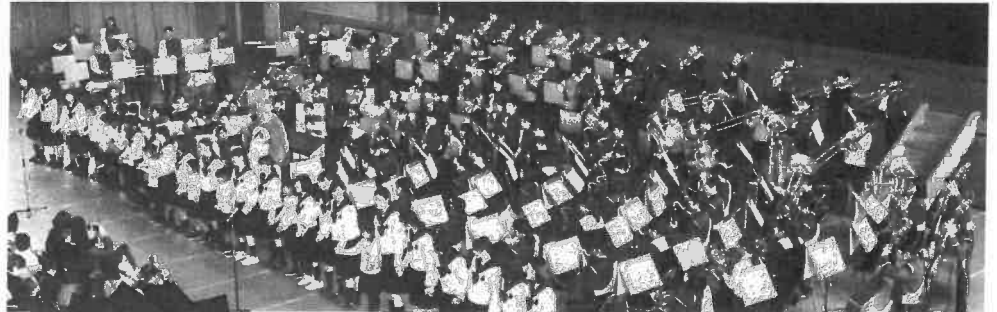
学校運営協議会主催行事「第13回つなぐ岡輝」