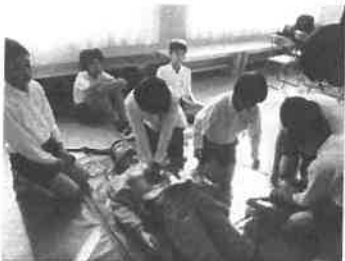
救急救命法実技を通して学ぶ

清輝小学校では、毎年10月にオープンスクールを開催しています。それに合わせて、岡輝中学校区で共通の取組である「みどりの林檎」として、全学年で命の大切さについて学ぶ授業をしています。外部の講師の方を招いて授業をしていただく学年も多く、子どもたちにとっては貴重な学びの場になっています。