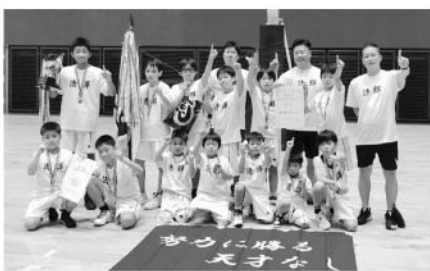
令和3年7月20日 山陽新聞