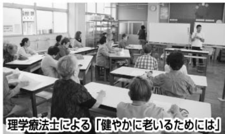
理学療法士による「健やかに老いるためには」