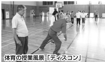
体育の授業風景「ディスコン」