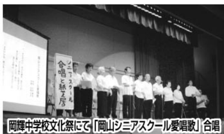
岡輝中学校文化祭にて「岡山シニアスクール愛唱歌」合唱