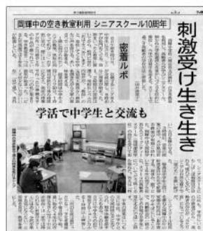
山陽新聞2013年2月9日号掲載