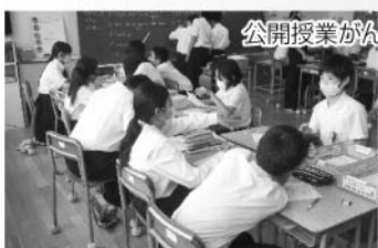
公開授業ががんばりました