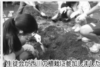
生徒会が西川の植栽に参加しました