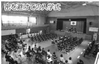
密を避けての入学式