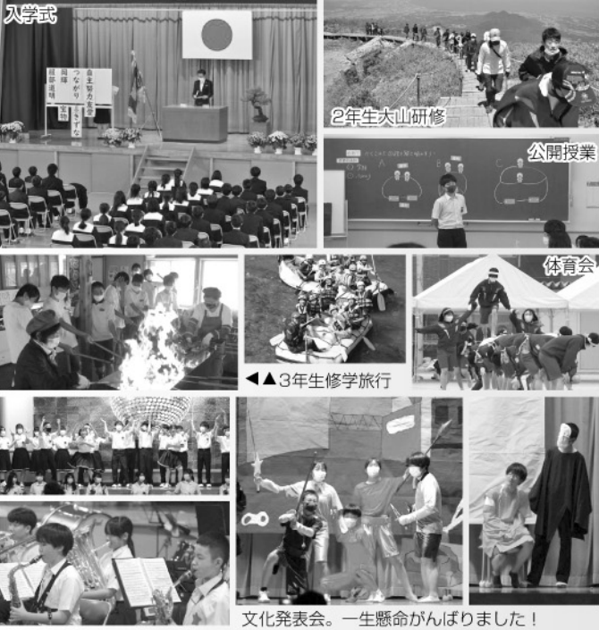
文化発表会。一生懸命がんばりました!

保護者や地域の皆さまのご協力をいただきながら、一つでも多くの中学校生活の思い出を作っていきたいと頑張っています!