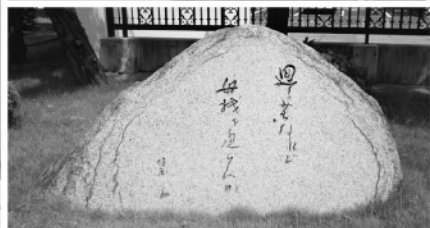
「廻り道なれど母校を通らんか」