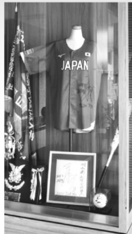
原田選手のユニフォーム

岡山南高校は130周年、150周年と迎えられるように頑張っていますので御支援のほど、よろしくお願いします。