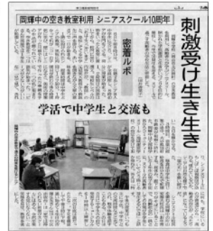
山陽新聞2013年2月9日号掲載