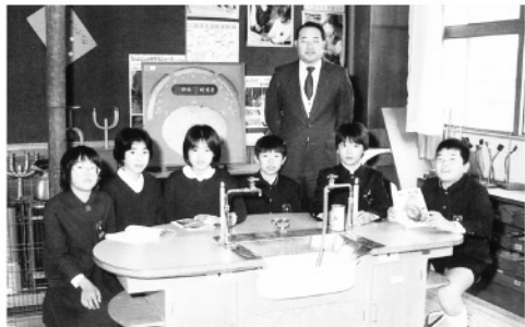
理科室で友人と先生と（左から4人目）

岡南小学校創立90周年ということで、少し当時のことを思い返してみたいと思います。