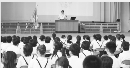
創立90周年記念式典の様子はP2～3に掲載されています。

また、子どもたちは、先輩が築き上げた岡南小学校のよき伝統を大切にしながら、自分たちの手で岡南小学校をよりよい学校にしようと頑張っています。どうかこれからも皆様の力強いご指導とご支援を賜りますようお願いいたします。