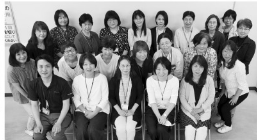
月1回岡輝公民館で開催される 岡山市民生委員児童委員協議会 北区中央福祉区主任児童委員部のメンバー (中央・清輝・鹿田・大元・御野・岡南・牧石・石井) (大野・三門・西・御南・陵南・吉備 14小学校区)