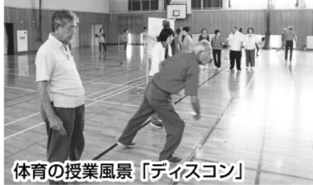
体育の授業風景「ディスクン」