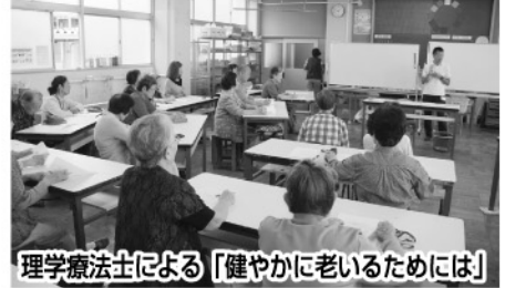
理学療法士による「健やかに老いるためには」