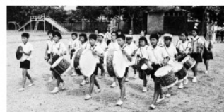
第17回国民体育大会出演のため練習中の太鼓隊。友達と共に頑張りました！

この地で育った私たちを、優しく包み込むように育ててくれたふるさと風景は、今でもしっかりと私の記憶のキャンパスに記されています。