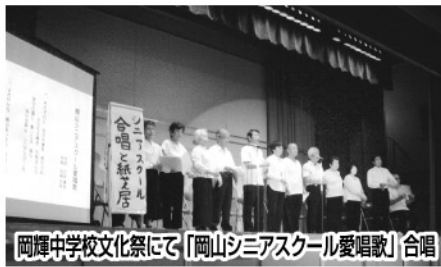
岡輝中学校文化祭にて「岡山シニアスクール愛唱歌」合唱