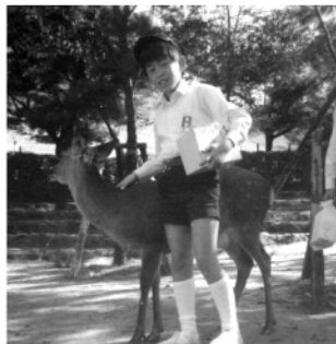
修学旅行（奈良公園）