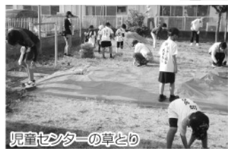
児童センターの草とり