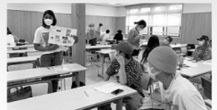
クールジャパン論という授業の風景です。スリランカの留学生が日本のクールなところを紹介しています。

外国語学部では、3つの柱、「生き方」「ジャパン・スタディ」「スタディ・アプロード(留学)」を基軸にカリキュラムを編成しています。そして、「楽しく学ぶ」をこの学部の方針としてきました。楽しくなければ続かないし、深い学びがない。英語は入学後、米国人、英国人、アイルランド人の3名の英語講師がダイレクト・メソッドで、楽しく、基礎から教えます。「英語を学ぶ」から、「英語で何かを学ぶ」力をつけてもらいます。その後、留学で実践的なコミュニケーション能力を身につけ、専門英語に挑戦していきます。国際政治経済学など専門英語科目は日本人の先生も英語で教えています。国際的な雰囲気の中で、楽しい授業を一度、味わってみませんか？