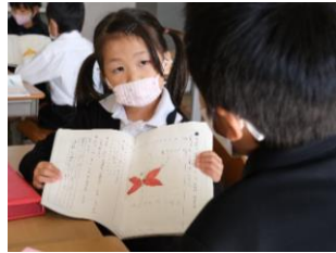
(上) 自分の思いを話す1年生。図を示しながら伝えると分かりやすいですね。 (左) 英語で道案内する5年生。英語での会話を楽しんでいますね。