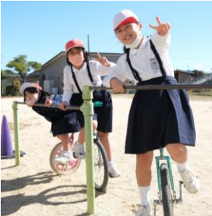
(上) いつも、元気！休み時間には、外に出て、しっかり遊んでいます。健康的！