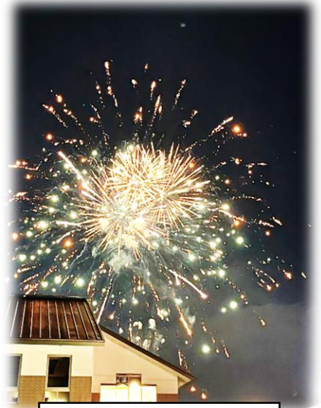
栢谷のお祭りの花火

どの様な夏休みを過ごされたでしょうか。お出かけをされたり、地域のイベントやお祭りに参加されたりと、各ご家庭でそれぞれに充実した夏休みを過ごされたことと思います。香和中学校区でも花火が夜空をかざったり、夜店が出たりと賑わいも戻ってきました。出会った子どもたちの笑顔が輝いて見えました。学校を離れた場で、子どもたちの成長を支えてくださっていることに心から感謝申し上げます。