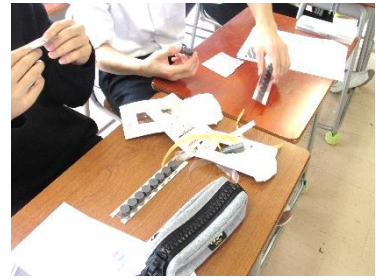
リニアモーターカーのしくみ

3年生では、商大附属高校の先生方をお招きして、「人工イクラの作成」、「中国語講座」、「リニアモーターカーの仕組み」、「ロボットについて」、「UVレジン の作成」、「マーケティングについて」などの出前授業を実施しました。それぞれ希望する講座を選び、高校で習う内容を中学生にも分かるように授業をしてもらいました。