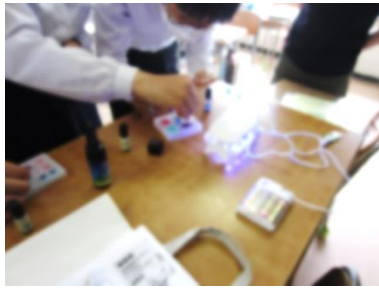
UVレジン の作成 (紫外線を当てて樹脂を固める)