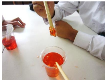
人工イクラの作成