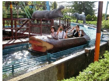
アトラクションを満喫したひらかたパーク