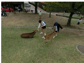
奈良公園では、かわいい鹿とふれあい

10月13日(木)、14日(金)に、6年生は、奈良、京都、大阪、滋賀方面に修学旅行に行ってきました。子どもたちは、歴史で学習したことを実際に見る楽しさ、友達と一緒に活動する楽しさ、お土産物をあれこれと選んで買う楽しさなど、いろいろな楽しさを感じることができました。そして、「最高の思い出」を作るために、めあてを、しっかりと意識して、6年生みんなで最高の修学旅行を創り上げることができました。小学校生活初めての宿泊学習になった修学旅行が実現したことに「感謝を表す姿」にも、6年生の成長している姿を見ることができました。これからも学校を力強く引っ張ってくれることを確信しています。