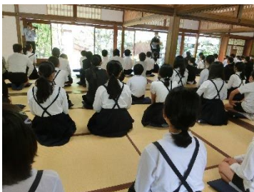
妙心寺では、貴重な座禅体験