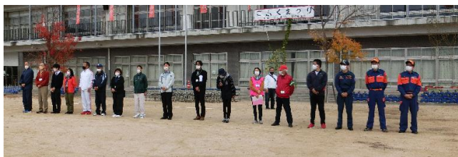
【開会式】多くの団体の方にご協力をいただきました。

制約のある中での実施となったため、各ブースの担当の方には、多大なご苦勞をおかけいたしました。どのブースとも趣向を凝らした内容で、多くの観客が訪れていました。また、ステージ発表では、ひまわりクラブが、「なわとび」と「一輪車」の演技発表、そして、西大寺中学校の吹奏楽部のみなさんが、見事な演奏の披露で会を盛り上げてくれました。また、体育館では、PTAの主催で、制服のリユース販売や岡山市消防局によるVR体験など、新しい試みも多く見られた内容になりました。