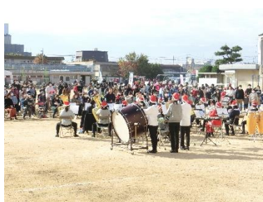
【西大寺中学校】吹奏楽部演奏