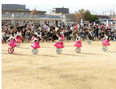
【ひまわりクラブ】一輪車演技

中心となって、企画運営してくださった「開かれた学校推進委員会」と「ごふくまつり実行委員会」の皆様を始め、たくさんの方のおかげで開催することができました。たいへんお世話になりました。ボランティアで参加してくれた児童の皆さんもありがとうございました。