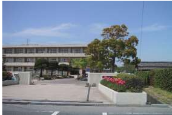
令和5年度 岡山市立操南小学校 【教室案内図】