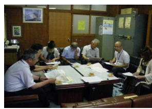
民生委員情報交換