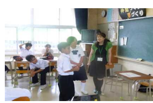
L S T授業実施