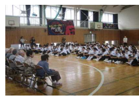
四季の里から雑巾贈呈式