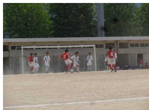
サッカー部初めての公式戦

今年の暑さは、例年以上に厳しいものがあり、各地で熱中症による被害の報告が聞かれます。足守中学校の6・7月は大きな事故も無く、充実した取り組みが展開されました。それらを振り返り、夏季休業中の生活に生かしていきたいと思ひます。