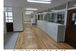
中学校普通教室前