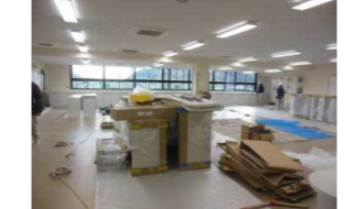
入口から見た職員室