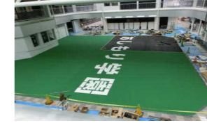
2階から見たギャラリー