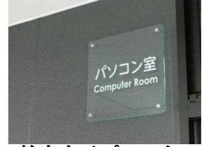
教室表示プレート