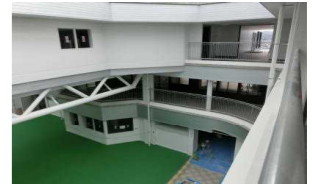
3階から見た南東部