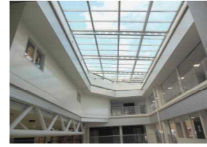
2階から見上げた天井