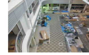
3階から見たギャラリー