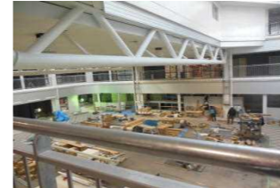
2階から見たギャラリー