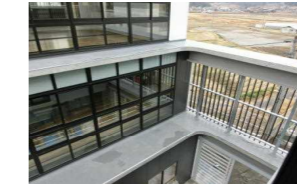
3階から見た南西部