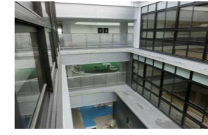
3階から見た東方面