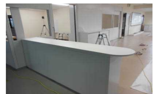
職員室入口カウンター