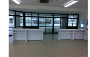
職員室側から見た入口