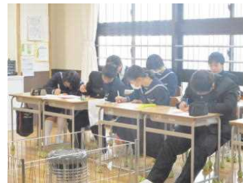
1年後の自分への手紙

3年間いろいろな ことがありまし た。その中で、一 番多かったのは授 業。協同学習で、 分からないを、聴 き合ひ合った大 きな財産です。こ れからも人とつな がり学び合ひてほ しいと思います。