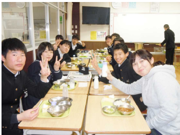
義務教育最後の給食