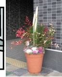
ももその 学園 作