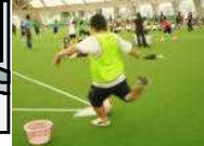
特別支援学級 球技会で優勝 しました。 於岡山ドーム