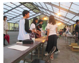
昨年度地域学習 で作成した看板 を立てていただき ました。→