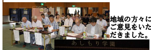
地域の方々にご意見をいただきました。