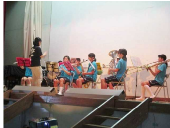
音楽部ステージ発表