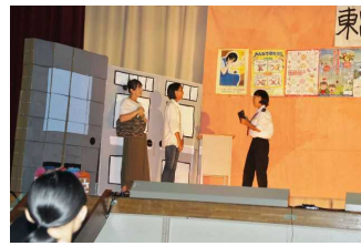
2年生ステージ発表