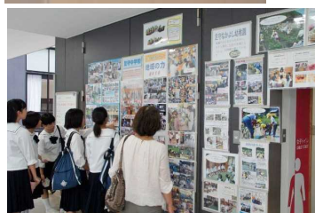
学校地域支援ボランティアの取組