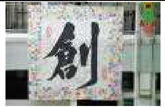
今年のテーマ「創」 C D組の作品

文化祭と3年生の地域学習発表会が終わりました。今年度から文化祭の中に3年生の発表として地域学習発表を加え、同日に開催いたしました。学年・委員会・部活動等、1学期から準備を始め、夏休みにもそれぞれの準備の取り組んできました。当日の発表はいかがでしたか。今年度のテーマは「創」。自分たちで考え、イメージを形につくり表現するために仲間とともにいろいろな工夫をし、取り組んできたものを当日発表しました。創りあげるその過程もふくめて、みんなよく頑張ったと思います。いろいろな場面でそれを認め合い、これからに活かしてほしいと思います。