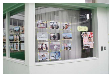
図書委員会：フォトコンテスト