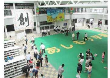
科学部：ギャラリーにて