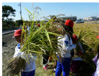
《全校で稲刈り 今年は手ごたえがやや軽い・・・》

稲刈りでは、PTA事業委員の皆様を始め、農業後継者の方々や地域の皆様には、大変お世話になりありがとうございました。岡山大学の学生ボランティアも参加してくださり、しっかりよい汗を流すことができました。1月には、お客様を招いて収穫祭をする予定です。今から、とても楽しみです。