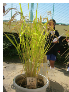
《バケツで色々な品種を育てました》