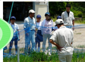
《かるがも見学: 興陽高校》

理由は: おじいちゃんやおばあちゃんが守ってきた大切な田んぼだ。干拓地を苦労して緑豊かな田んぼに育ててきたんだ。