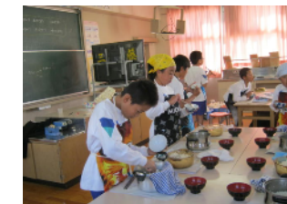
《朝日・あけぼの・こしひかり等様々な銘柄の米を炊いて試食会》