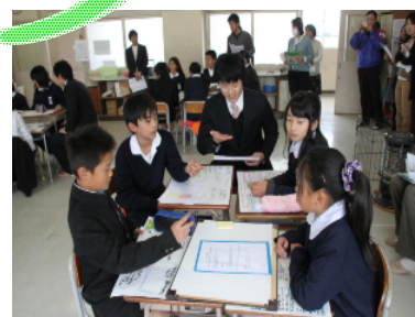
《授業中のディスカッションも大切 大学生に力を借りました》