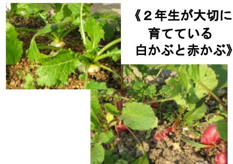
《2年生が大切に育てている白かぶと赤かぶ》

明日から楽しい冬休みに入ります。風邪をひかないように事故にあわないよう注意して、よいお年をお迎えください。