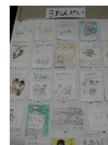
《おすすめの本コンクール》

楽しかったりためになったりした本を紹介します。同名の本でもそれぞれの個性が感じられ、興味深く読みました。