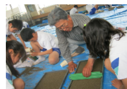
《初まきから学習のスタート!》

総合的・多面的に考え、行動していくことのできる普遍的な力を身に付けさせる教育です。