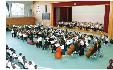
音楽鑑賞 関西フィルと吹奏楽部