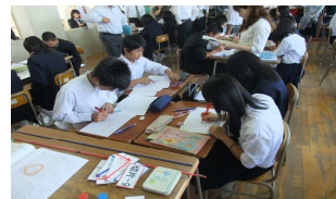
グループ学習風景