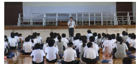
真剣に話を聞く1年生