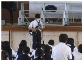
2年生パフォーマンス大会