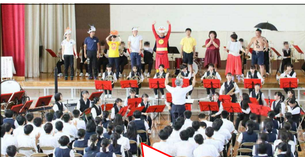
先生方とのコラボのステージ。吹奏楽の楽曲に合わせて先生方が楽しくダンスを披露しました！