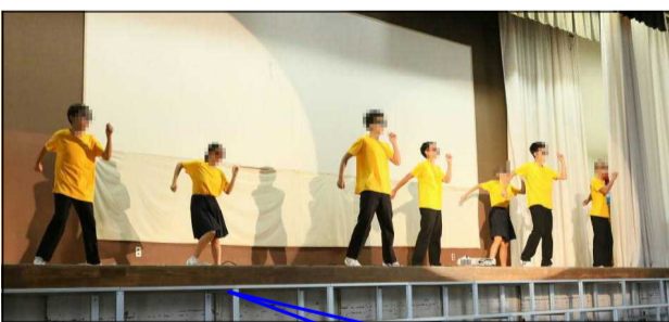
ノリノリのダンスやビデオで文化祭に勢いをつけました。