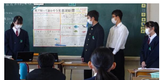
環境学習発表会の様子