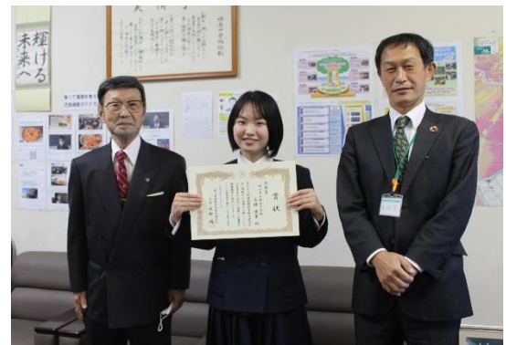
表彰式、校長室にて