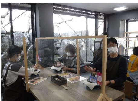
岡山城での備前焼体験