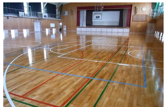
床はピカピカ、ラインもきれいです。

また、今年度は3学期にもテニスコートの改修工事も予定しています。ご不便をおかけしますが、ご理解とご協力をよろしくお願ひいたします。