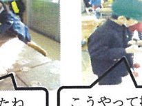
こうやって持つといいよ。