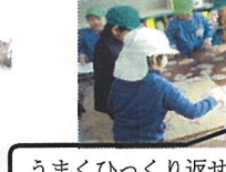
うまくひっくり返せたね。