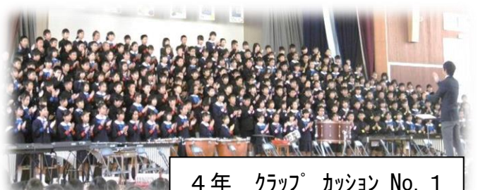
4年 クラップ カッション No. 1