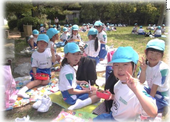
1年生 深山公園（玉野市）

1, 2, 3, 4, 6年生が校外行事を行いました。少し雨に遭った学年もありましたが、無事に行事を終えることができました。