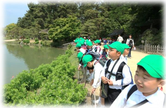
3年生 岡山城・後樂園