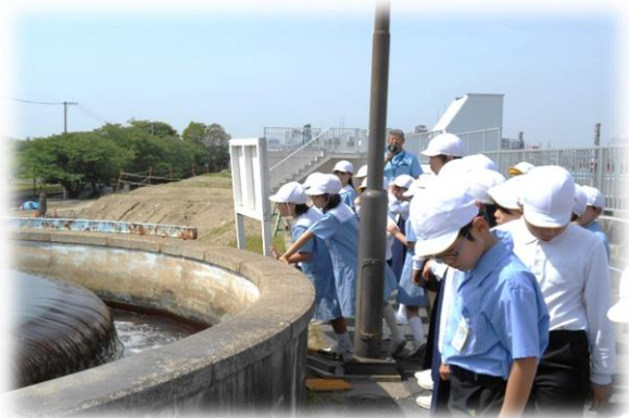
4年生 三野浄水場・当新田クリーンセンター