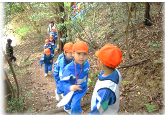
2年生 小鳥の森（三徳園）