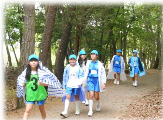
6年生 備中国分寺（吉備路）