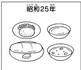
コッペパン・ミルク(脱脂粉乳)・ポタージュスープ・コロック・せんキャベツ・マーガリン