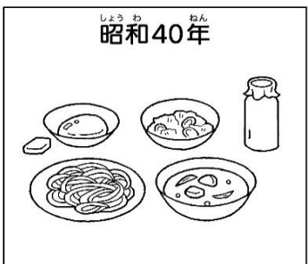
ソフトめんのカレーあんかけ・牛乳・甘酢あえ・果物(黄桃)・チーズ