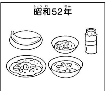
カレーライス・牛乳・塩もみ・果物(バナナ)・スープ

※献立の内容は、独立行政法人日本スポーツ振興センターの献立レプリカを参考にしています。