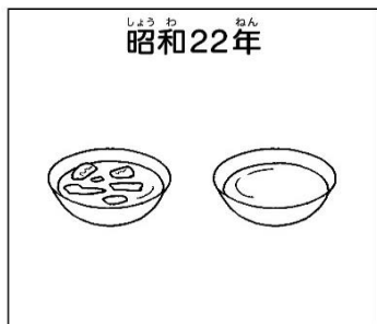
ミルク(脱脂粉乳)・トマトシチュー