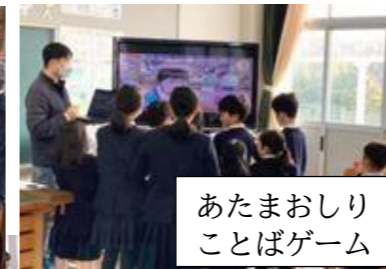
あたまおしり ことばゲーム