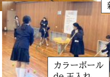
カラーボール de 玉入れ