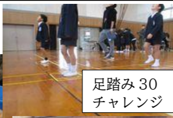
足踏み30 チャレンジ