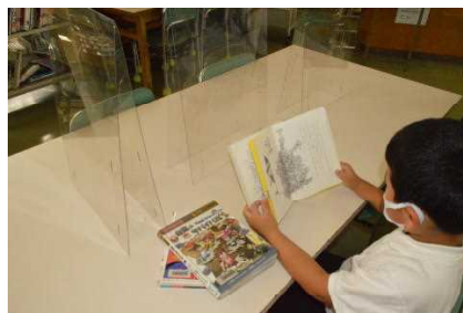
図書館のアクリル板