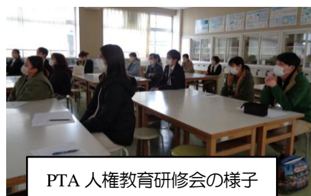
PTA 人権教育研修会の様子

6校時には、PTA 人権教育研修会がありました。いじめに関する動画を視聴した後、グループで意見や感想を交流しました。子どもたちの日常にありそうな具体的な事例で、いじめについて考える機会をもてたことは大変有意義だったと思っています。私たち大人が人権感覚を豊かにしていくことの大切さを改めて感じました。研修会を計画運営してくださった PTA 役員の皆様、本当にありがとうございました。