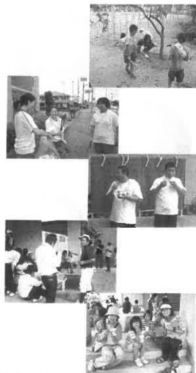
「清掃終了後岡輝中へ集まってかき氷」